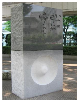
とりぎん文化会館正面 入り口前にある 「ハンセン病強制隔離 への反省と誓いの碑」

人権教育・啓発を推進してきた鳥取県人権教育推進協議会としては、偏見や差別の拡大は大変遺憾であり、決して見過ごすことはできません。新型コロナウイルスの問題から学び、教訓とすることが、何より大切だと考えます。そこで、以下のように今年度の研究集会『特別講座』を開催することとしました。