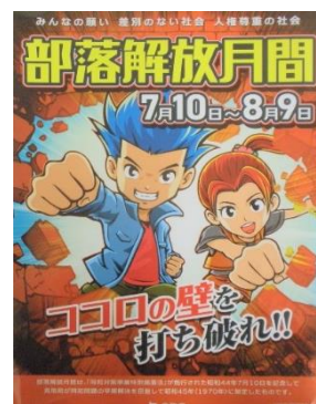
鳥取県部落解放月間のポスター

部落解放月間は「同和对策事業特別措置法」が施行された昭和44（1969）年7月10日を記念して、鳥取県が翌年の昭和45（1970）年に制定しました。毎年7月10日から8月9日の期間中、県民一人ひとりが人権・同和問題を正しく理解し、認識を深めていくための研修会や講演会が行われる月間です。